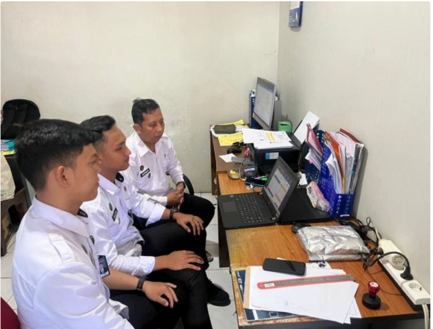
Lapas Narkotika Purwokerto Raih Apresiasi Tinggi dalam KPPN Purwokerto Awards TA 2025

Purwokerto – Lembaga Pemasyarakatan Narkotika (Lapas) Kelas IIB Purwokerto, telah dilaksanakan kegiatan Rapat Koordinasi Evaluasi Kinerja